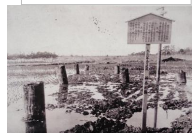
大正13年当時の旧橋脚