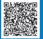
申込フォームQRコード

【FAX】 045-210-8855 (神奈川県 環境農政局 水・緑部 水源環境保全課)