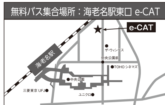
海老名駅東口から徒歩7分

無料バス 往路：海老名駅 e-CAT 集合(9:00)→猿橋→桂川ウエルネスパーク→大月市民会館(12:30) 復路：大月市民会館(17:00)→海老名駅 e-CAT(19:00)